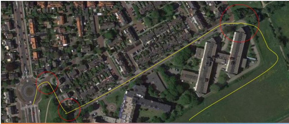
Realistische route met aandachtspunten

De volgende route die wordt besproken, is volgens de ontwikkelaars de meest realistische route. Hoewel ook deze gepaard gaat met uitdagingen en aandachtspunten. Via deze route rijdt bouwverkeer via de rotonde naar de Albert Verweyalaan om vervolgens af te slaan naar de Lodewijk van Deysellaan en bij Huis ter Hagen het terrein op te rijden. Er zijn drie knelpunten, waaronder de entree van Huis ter Hagen. Die draai kan het bouwverkeer nu niet maken. De weg zal daarom iets moeten worden verlegd (zie afbeelding in presentatie). De gemeente, van wie de omliggende grond is, staat hiervoor open. De ontwikkelaars gaan hierover ook in gesprek met Huis ter Hagen. De andere knelpunten zijn de hoek Lodewijk van Deysellaan – Albert Verweyalaan en de hoek van de Albert Verweyalaan bij de rotonde. Deze punten moeten overzichtelijk worden gemaakt, bijvoorbeeld met spiegels. En bij speciaal vervoer, zoals uitzonderlijk zware of lange voertuigen, kunnen er verkeersregelaars komen.